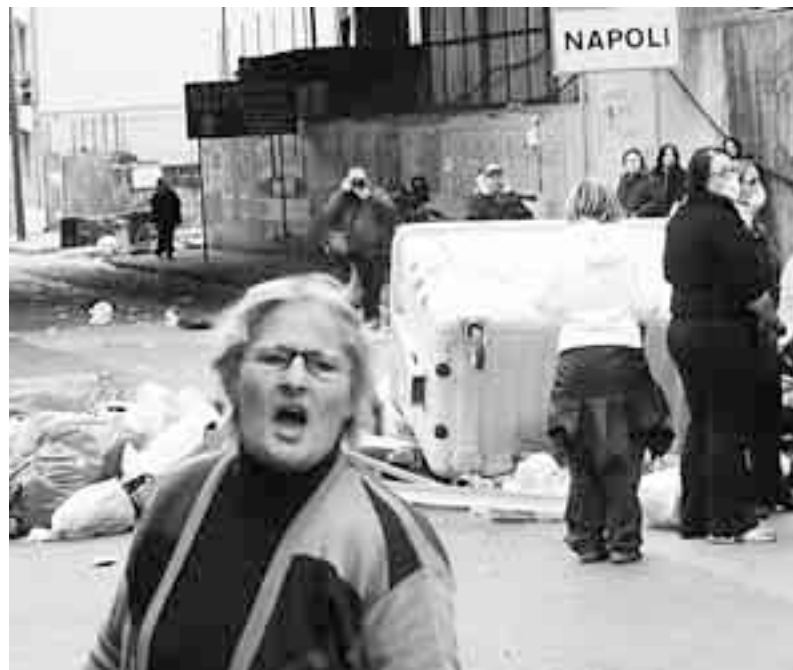
DONNE NELLE STRADE VERSANO LA SPAZZATURA SULL'ASFALTO

Nel raggio di una decina di chilometri, infatti, si contano sei discariche esauste, un impianto di Cdr, e due siti per lo stoccaggio delle cosiddette ecoballe, tra cui quello di "Taverna del Re", dove sono sistemati più di due milioni di tonnellate di spazzatura triturrata e impacchettata.